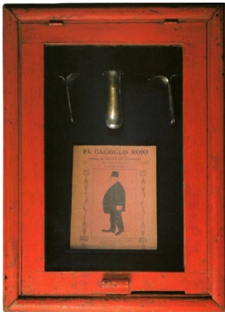
El glóbulo rojo Caja de extinguidor de incendios, revista de medicina y espéculos. 1999