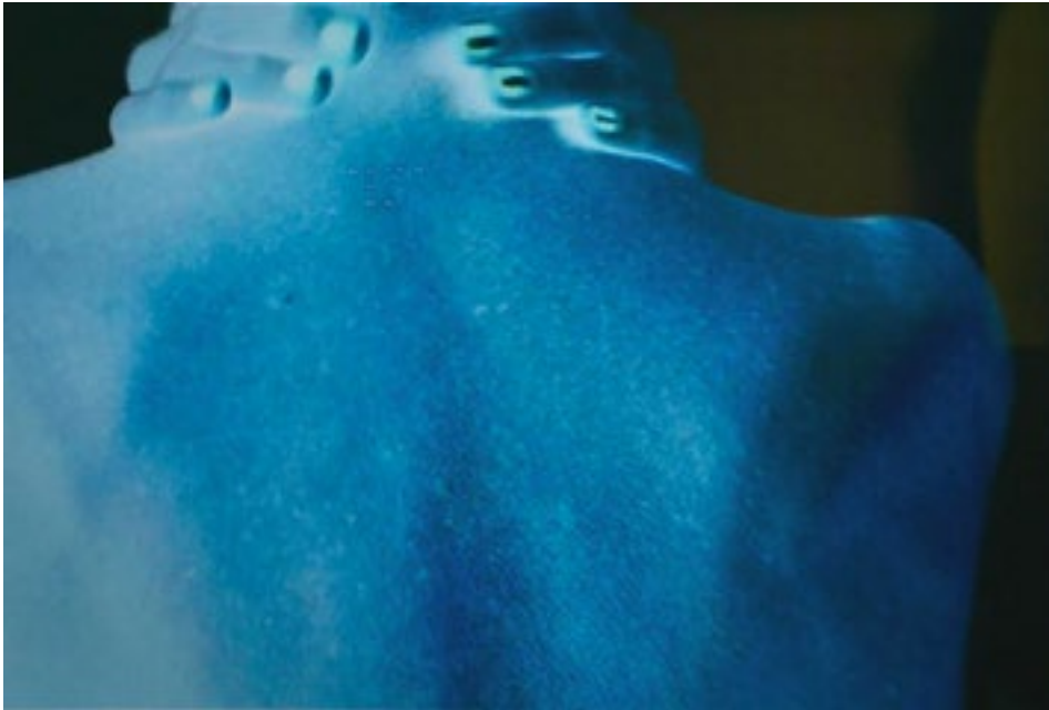
Oblivion-Alma-Laberinto Toma directa intervenida con texto Braille. 2003