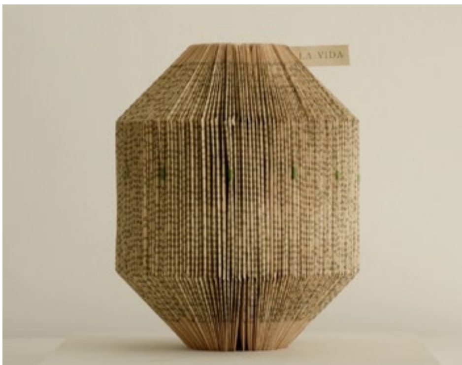
La vida Objeto - Libro de medicina. 2017