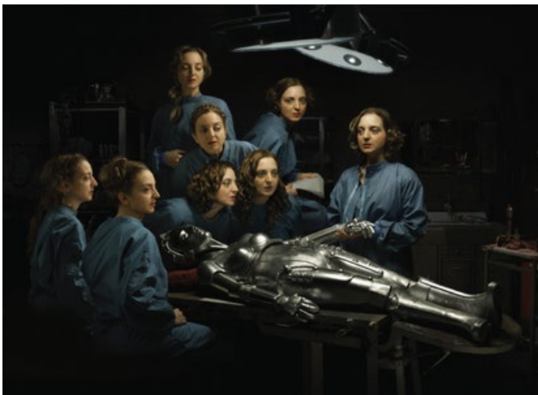
Lección de anatomía del Dr. Nicola Costantino Impresión Inkjet. 2015