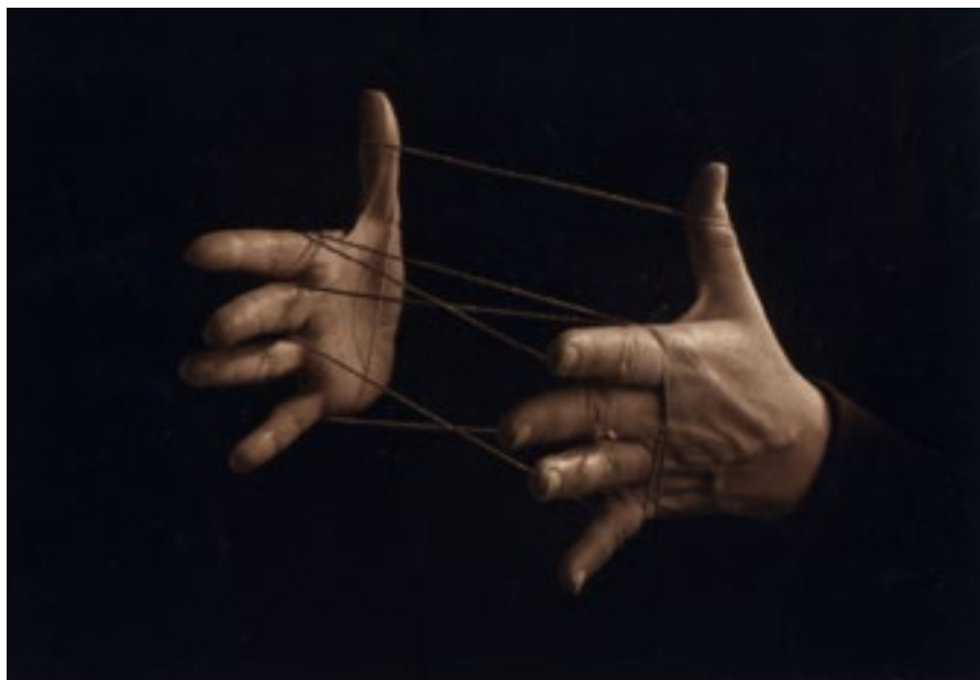
Juego de manos Fotografía digital. 1992