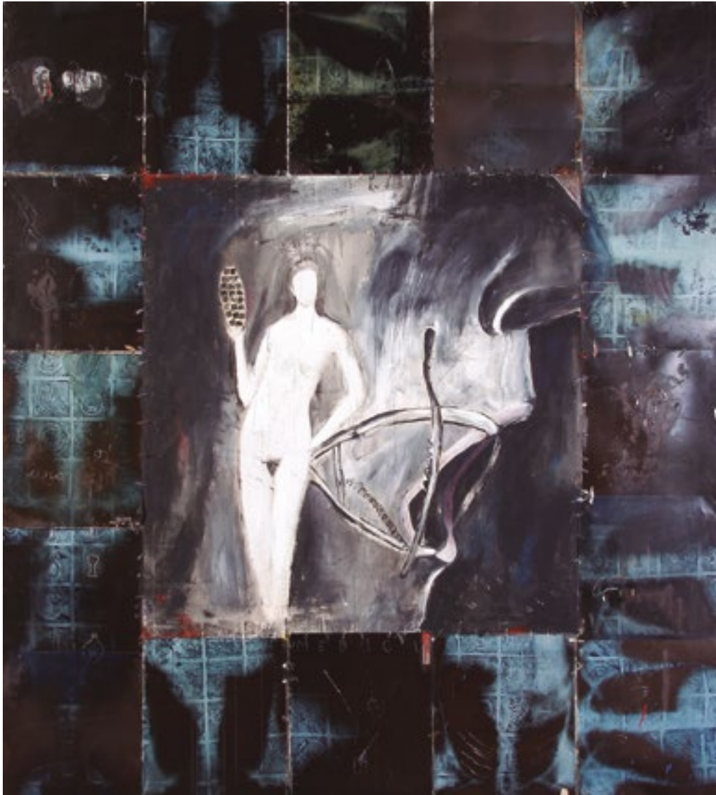
El grito Radiografías, espejo y acrílico sobre tela. 1992