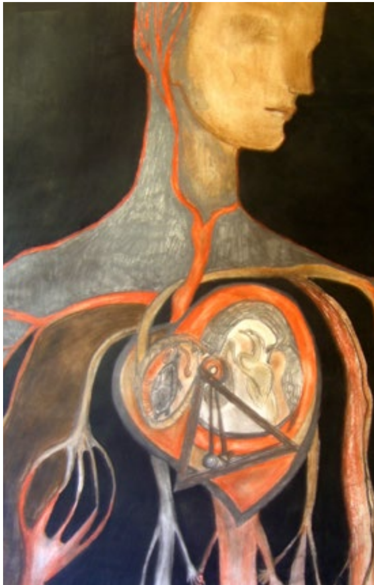
En mi corazón Dibujo con lápiz, sepia y carbón. 1983