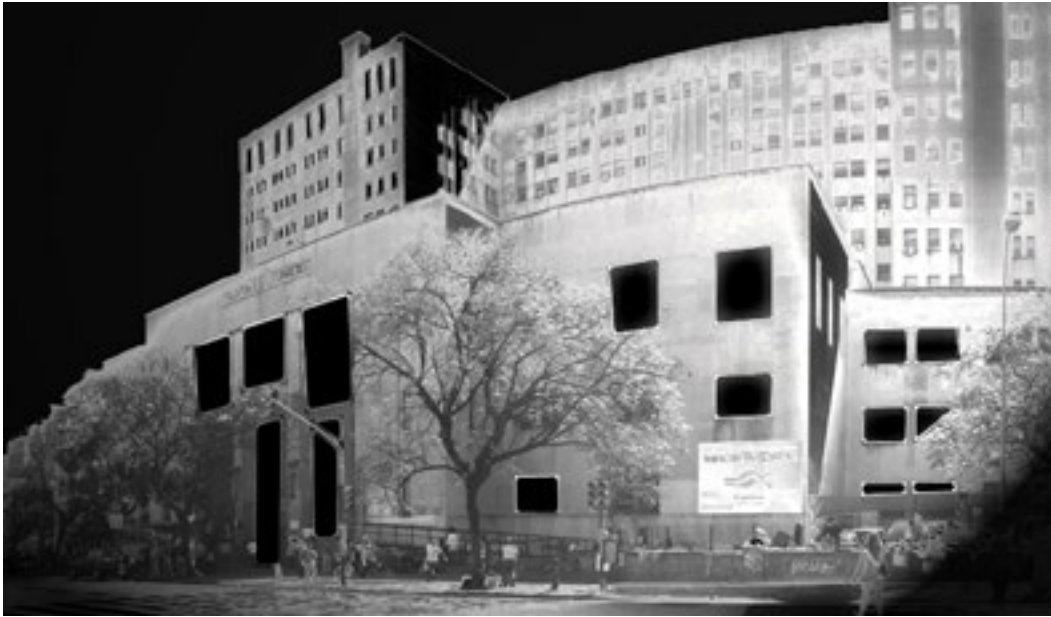
Restauración I Fotografía digital intervenida