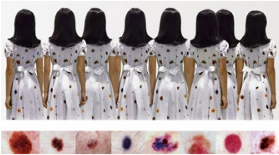
Maladie Fotografía digital intervenida