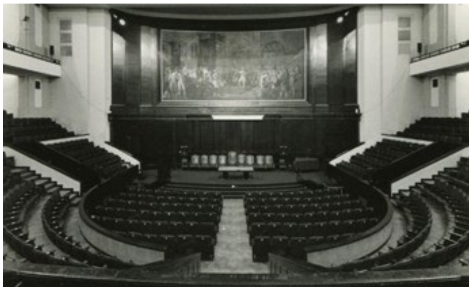
Aula Magna Facultad de Medicina Fotografía analógica. 2017