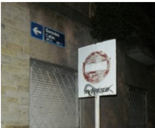
Figura 4: Calle González Catán.

manera con lujosas quintas y caserones, que le dieron el aspecto residencial que aún conserva.