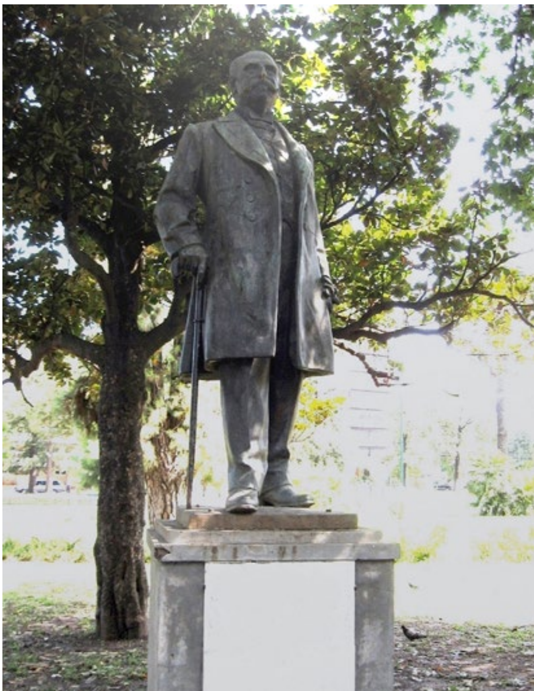
Figura 2: Estatua de Antonio Devoto en la Plaza Arenales, obra del escultor florentino Arnoldo Zocchi. Esta plaza se llamaba anteriormente "Santa Rosa", nombre atribuido en honor a la madre de Antonio Devoto, Rosa Vaccarezza o a su primera esposa, Rosa Viale.

presidente del banco, el nuevo pueblo tomó su nombre: Villa Devoto.