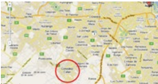
Figura 8: Ciudad de González Catán.