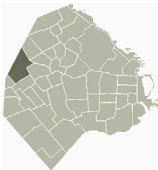
Figura 1: Barrio de Villa Devoto.

Esas tierras, que eran propiedad de don Manuel Santiago Altuve, fueron adquiridas en 1889 por el Banco Inmobiliario, de quien Antonio Devoto era su presidente, para emplazar en la zona un nuevo pueblo. El proyecto fue aprobado por la Municipalidad de la Ciudad de Buenos Aires el 13 de abril de 1889, dándose este día como fecha fundacional del barrio. En homenaje al