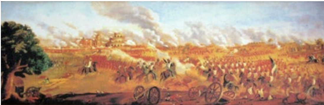
Figura 6: Batalla de Caseros. Cuadro del pintor uruguayo Juan Manuel Blanes.