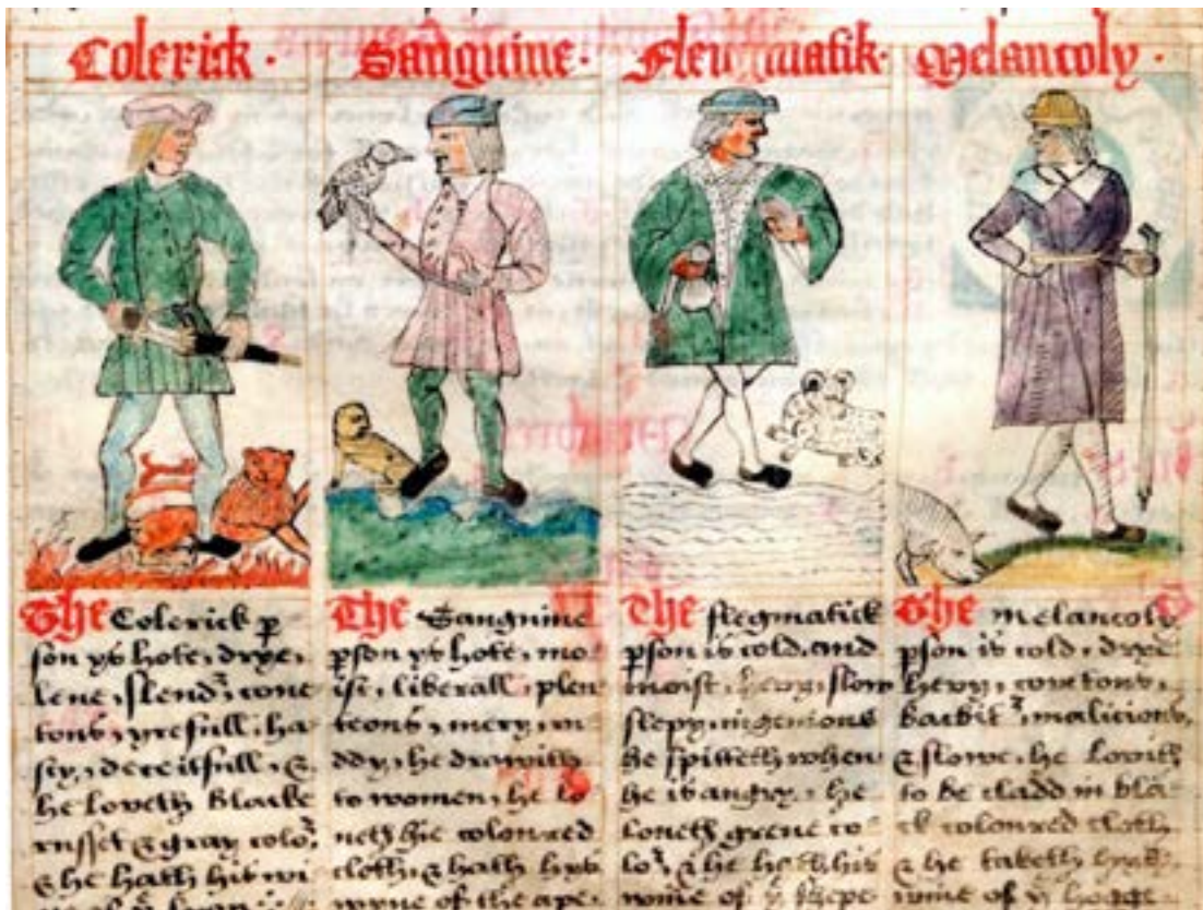
Figura 1: Dibujo medieval mostrando los cuatro temperamentos: colérico, sanguíneo, flemático y melancólico