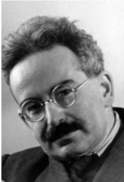
Figura 8: El escritor alemán Walter benjamín (1892-1940)

se le fue agregando, en las últimas décadas, la nota de un tedio particular que se expresa en la acentuación de la incapacidad del sujeto para significar, para otorgar sentido al mundo circundante.