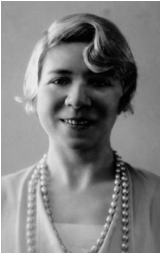
Figura 5: La poetisa Alfonsina Storni, nacida Sala Capriasca (Suiza) en 1892 y fallecida en Mar del Plata en 1938.

derrumbarse las unas sobre las otras; al ver el pequeño pedazo de cielo que les cubría, encapotado y sombrío, tanto que podía creerse no llegaría jamás a iluminarlo un sol claro y transparente, el corazón de Flavio se oprimió y experimentó tedio y disgusto de la vida."