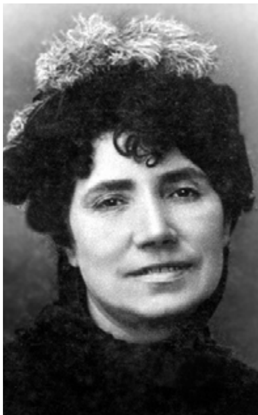
Figura 4: La escritora gallega Rosalía de Castro (1837-1885). Fotografía de 1880.