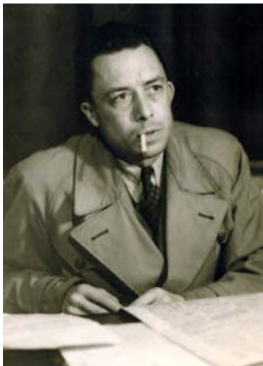
Figura 3: El escritor francés, nacido en Argelia, Albert Camus (1913-1960) en 1957

"Al cruzar aquellas calles, enlodadas y angostas; al contemplar aquellas casa de abigarrado color, que parecía iban a