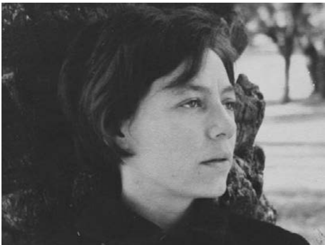
Figura 7: La poeta argentina Alejandra Pizarnik (1936-1972), fotografiada por Sara Facio en 1967.

del esplín, lo humano pareciera tornarse un objeto más de la urbe, tan fútil como el cemento. El dilema existencial se anula así de modo certero, ya no hay oscilación en el extremo del hombre cosificado.