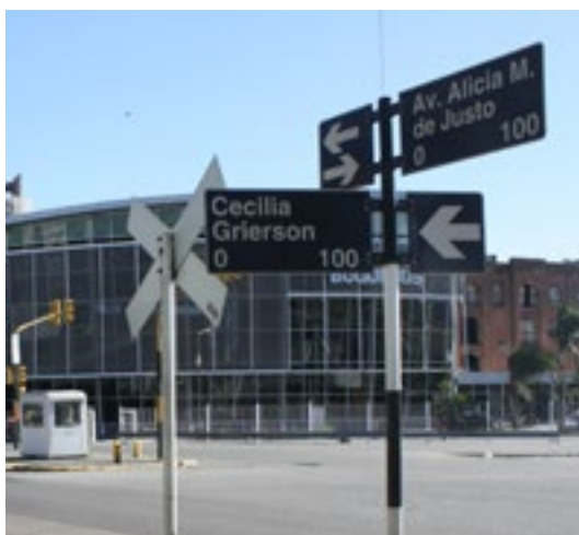
Figura 11: Esquina Cecilia Grierson y Alicia M. de Justo.