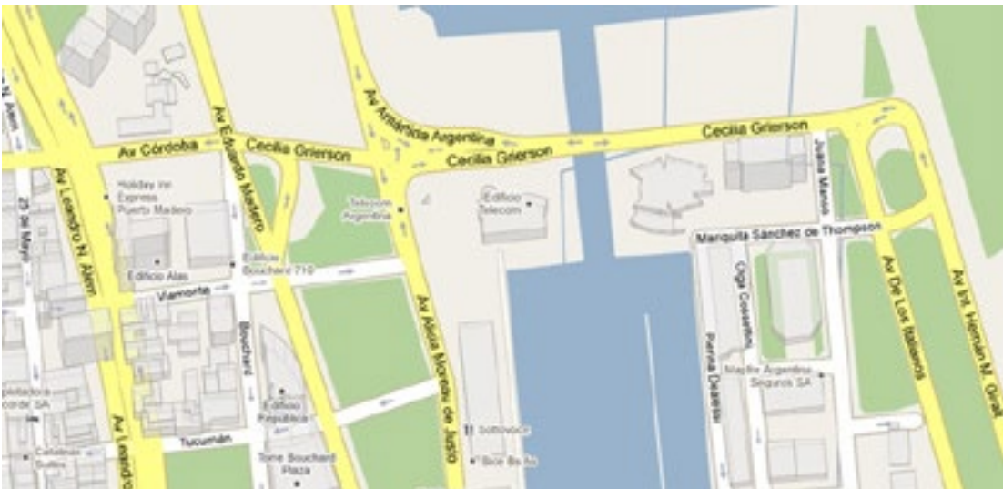
Figura 10: Calle Cecilia Grierson.

La ciudad de Buenos Aires le puso su nombre en 1980 a una de sus plazas, ubicada sobre la vereda Oeste de la Calle San Juan al 600, entre Chacabuco y Perú (ordenanza N° 35.659-1980), y en 1995 a una de las calles del nuevo barrio de Puerto Madero (ordenanza N° 49.668-1995),