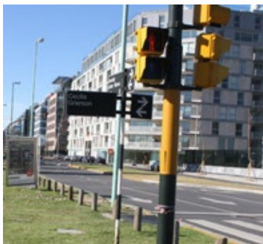
Figura 12: Esquina Cecilia Grierson y Juana Manso.

la “Fundación Cecilia Grierson”, gracias a las ideas de un grupo de médicas que creyeron que su tarea profesional iba más allá de lo meramente asistencial. Pensaron que era necesario poder informar a la comunidad sobre distintos temas que, conociéndolos con más profundidad se traducen en una mejor calidad de vida.