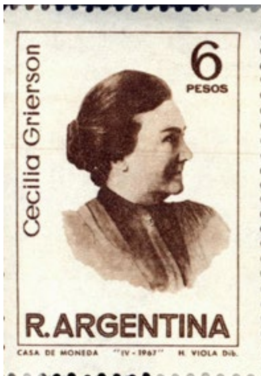
Figura 6: Estampilla de 1967.

En su homenaje, en 1935 se le dio su nombre a la Escuela Superior de Enfermería de la Ciudad de Buenos Aires, ubicada en la calle Ambrosetti 601. En 1967 se editó una estampilla con su nombre.