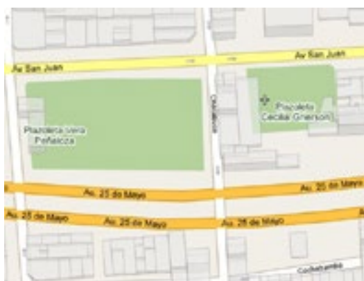
Figura 8: Plaza Cecilia Grierson.