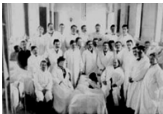
Figura 2: En la Facultad de Medicina.