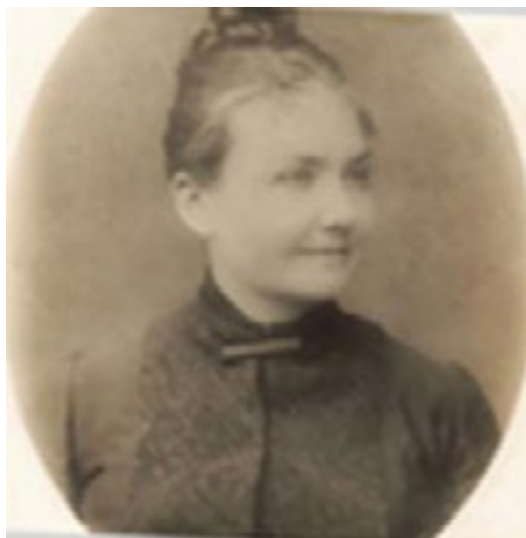
Figura 1: En su juventud.