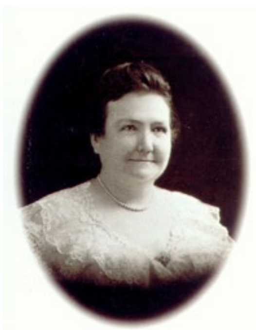
Figura 0: Cecilia Grierson (1859-1934).

A partir de esto, la zona de Puerto Madero quedó relegada y un tanto aislada de la ciudad, más allá de la inauguración del Balneario Municipal en 1918, y la apertura en la década de 1920 de una serie de cervecerías, que ofrecían a los visitantes números de variedades ( varietés ), siendo la más famosa "la Munich" (hoy sede de la dirección General de Museos). En la década de 1950 la Costanera Sur empezó a perder terreno en las preferencias de los porteños. En las décadas de 1970 y 1980 se rellenaron terrenos aledaños al río, clausurando definitivamente el balneario y