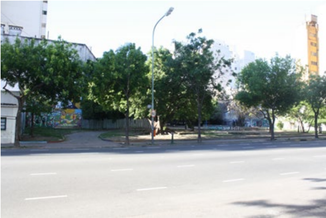
Figura 9: Plaza Cecilia Grierson (Av. San Juan al 600).