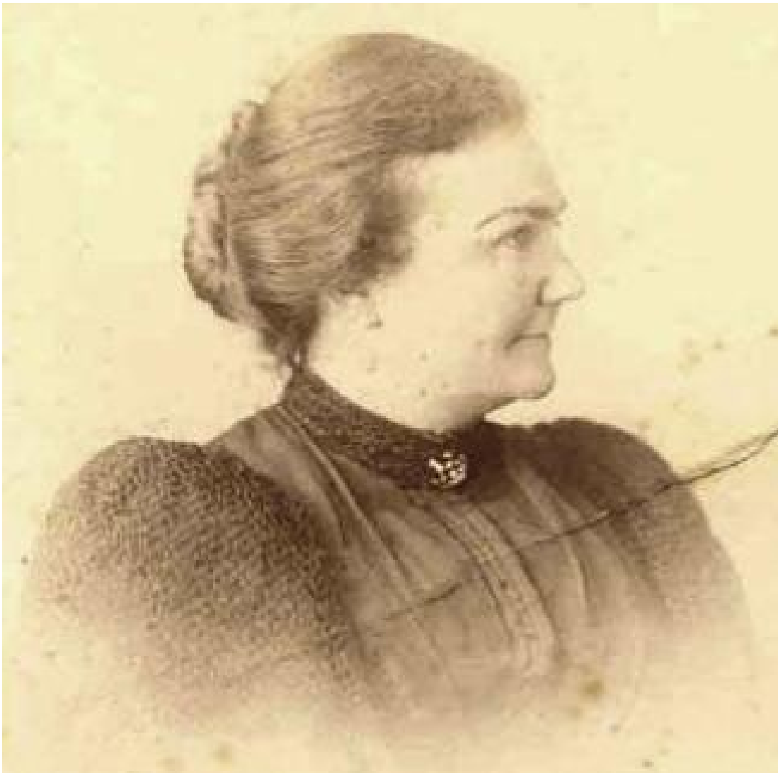
Figura 5: En su madurez.

libro, "La educación del ciego y el cuidado del enfermo" .