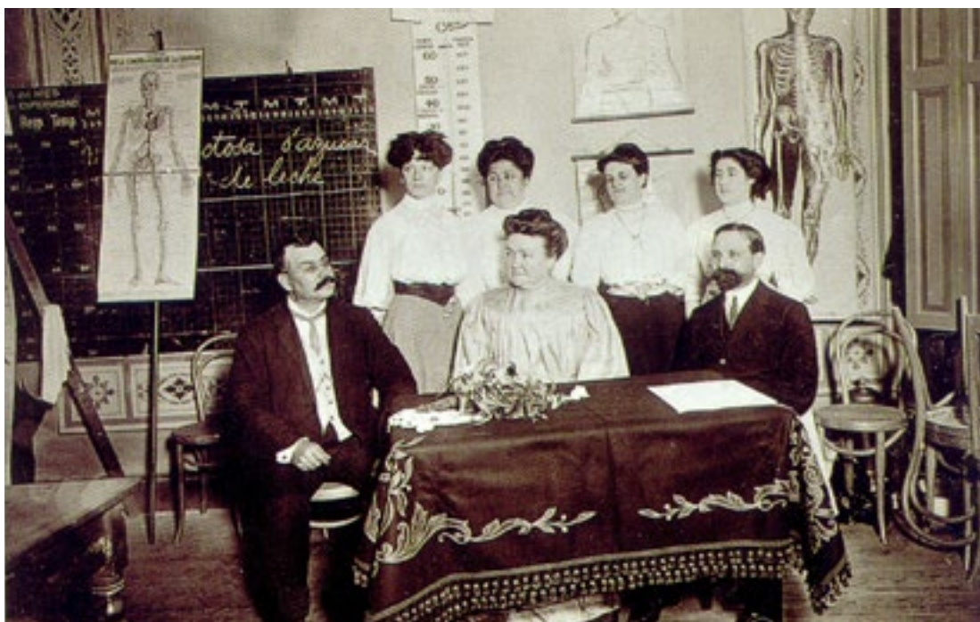
Figura 4: Tomando examen.

En 1899 publicó su libro "Educación Técnica para la Mujer" , y en 1910 publicó otro