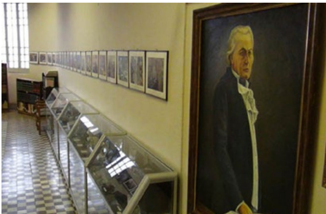
Figura 6: Exhibición de 50 fotografías a colores que muestran la evolución de la historia de la medicina mundial, junto con 10 vitrinas donde se expone la historia de los diferentes instrumentos médicos.

En 1880 se terminó de construir el nuevo hospital pasando a ser administrado por las religiosas de la Orden de Santa Ana. La edificación original de este hospital