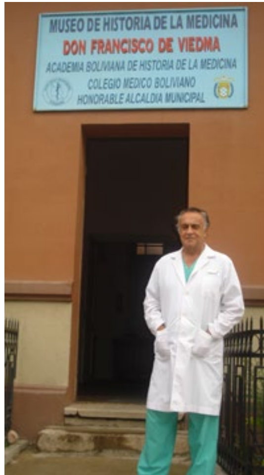
Figura 3: Entrada actual del Museo de Historia de la Medicina “Francisco de Viedma”.

A partir del año 1900, la ciudad de Viedma, luego de haber sido arrasada en 1899 por una inundación, fue confirmada como capital del Territorio Nacional del Río Negro, al dividirse en varias unidades el Territorio Nacional de la Patagonia.