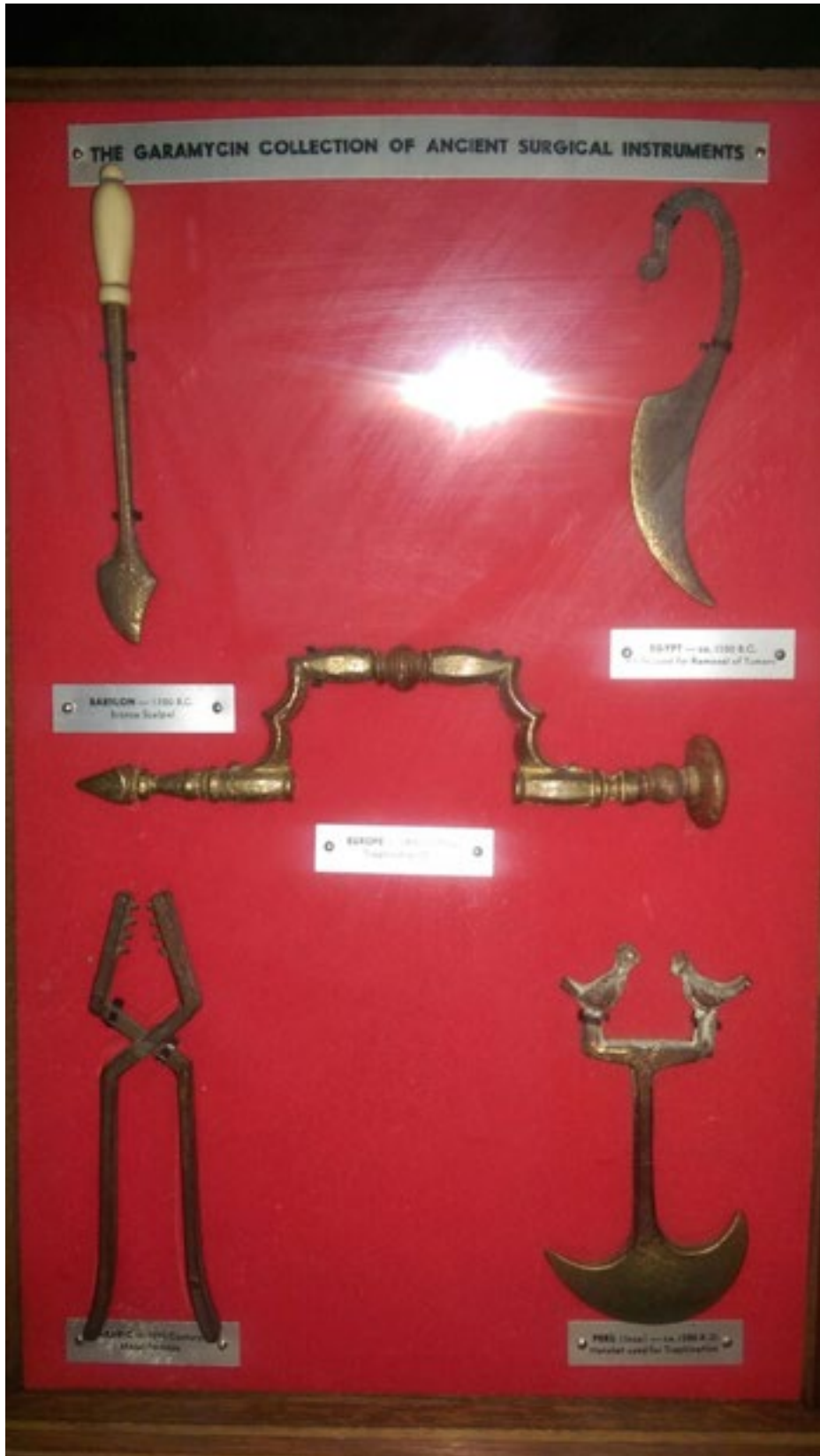
Figura 7: Colección de instrumentos quirúrgicos antiguos.