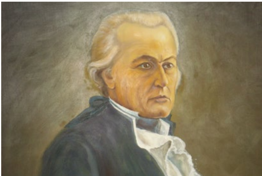
Figura 1: El marino Francisco de Biedma y Narváez.

Estando en el Virreynato del Río de la Plata, el 15 de diciembre de 1778 zarpó