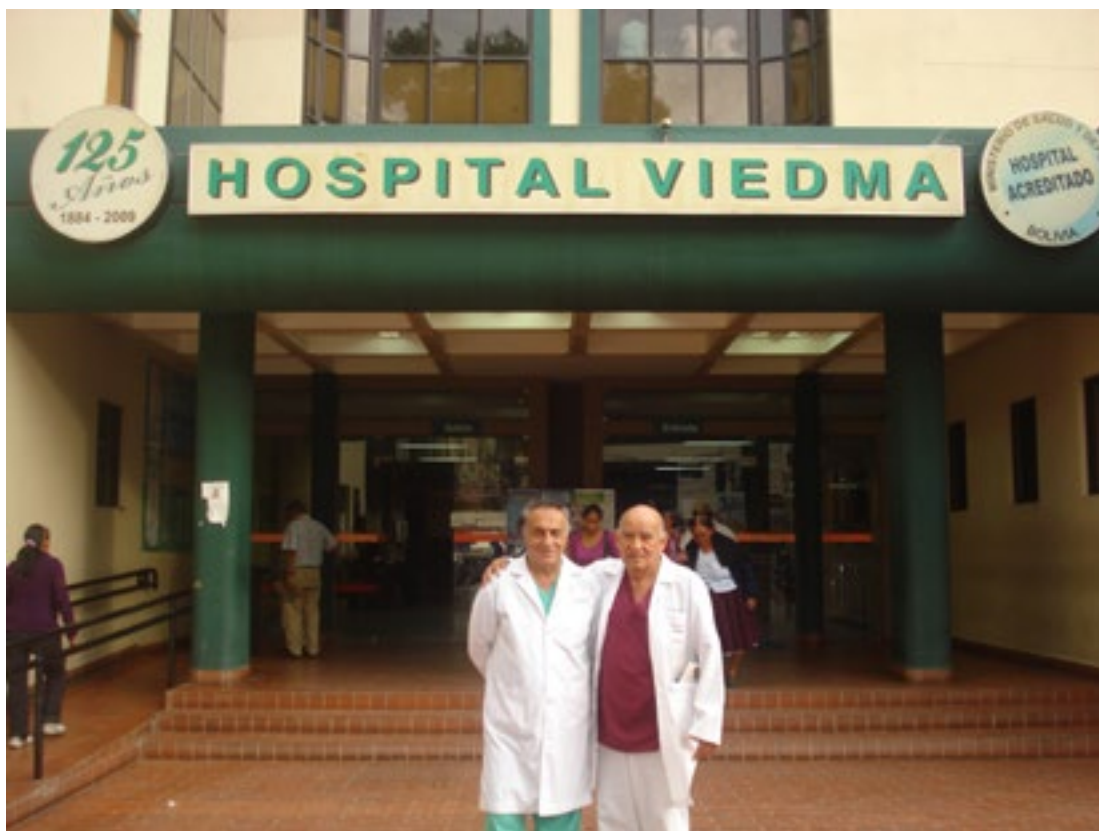
Figura 2: Frente actual del Complejo Hospitalario Viedma.

de Montevideo, junto con el marino Juan de la Piedra, al mando de una expedición organizada por el Virrey Juan José Vertiz, con la finalidad de explorar el sector de las costas patagónicas y construir asentamientos, fuertes, poblaciones .