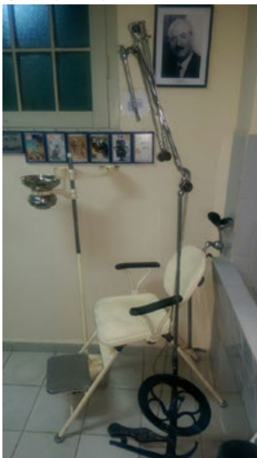
Figura 11: Equipo odontológico.

una serie de equipos médicos empleados en el Hospital Viedma entre 1800 a 1880. Se pueden apreciar 2 electrocardiógrafos Einthoven de 1900, además de 2