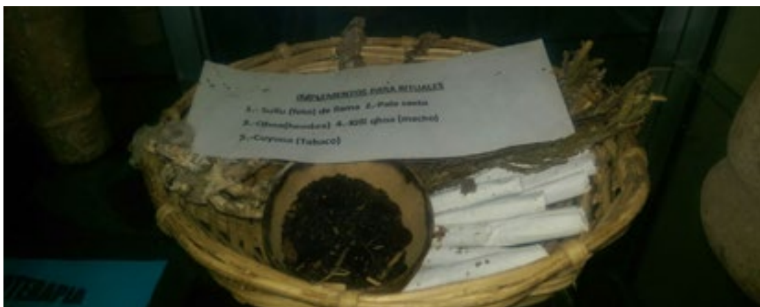
Figura 10: Implementos para rituales de la medicina tradicional local.