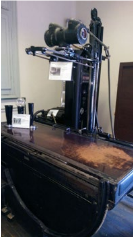
Figura 8: Antiguo equipo radiológico.

fue la misma casa de Viedma, que luego se transforma en el Complejo Hospitalario Viedma (figura 2). (6)