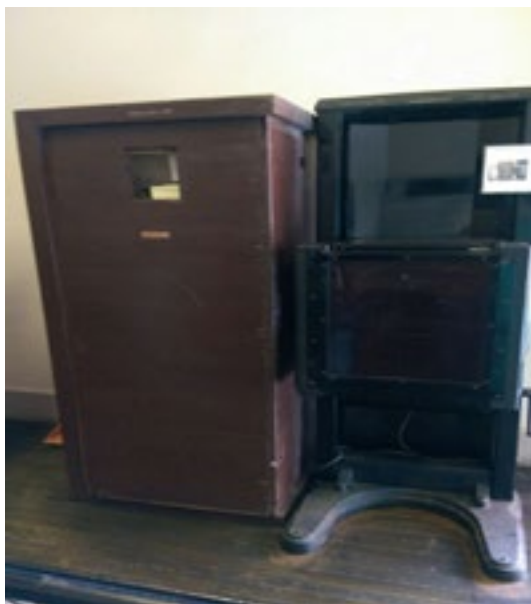
Figura 5: Equipamiento radiológico (1950)

sobre el desarrollo de la ciudad de Viedma, la suerte de su fundador no termina en las tierras patagónicas, sino fue enviado por los reyes de España como gobernador a Bolivia.