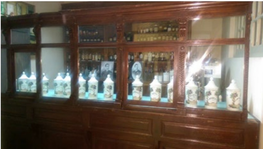
Figura 4: Objetos de la primera farmacia de Cochabamba (1810)