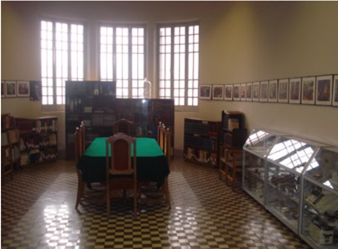
Figura 12: La antigua sala de cirugía con su iluminación natural y su piso embaldosados (actualmente es una sala de exposición y resguardo del patrimonio médico de Cochabamba).

libros, fotografías, etc, sino además se puede llegar a apreciar las características que tenía la sala de cirugía con su iluminación natural, su pisos embaldosados y que ahora es lugar de exposición y resguardo del patrimonio médico de Cochabamba (figura 12).