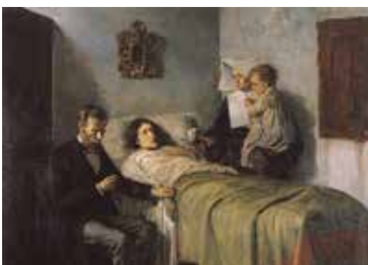
"Ciencia y Caridad" en una estampilla española de 1978.