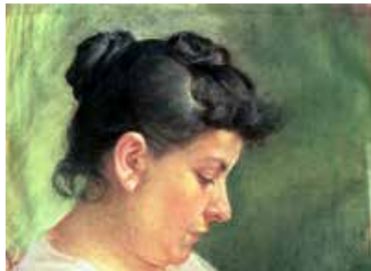
Bocetos para "Ciencia y Caridad".