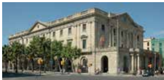
Radiografía del cuadro "Ciencia y Caridad".