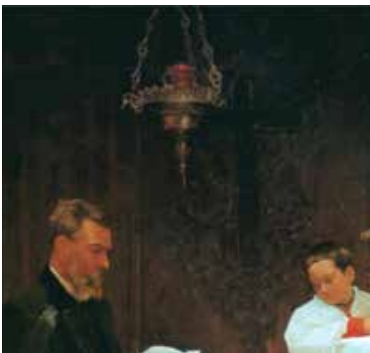
Tareas de restauración del cuadro "Ciencia y Caridad" (1970).

La escena representa un médico tomando el pulso a una enferma postrada en la cama de una modesta alcoba. Al mismo tiempo, una monja le ofrece un tazón sosteniendo a su hijo. La obra nos muestra un acto médico. La forma en la que el médico toma el pulso de la enferma y su estilo serio nos dice que él aporta la ciencia involucrada en el cuidado de la paciente. La monja, ofreciendo una bebida y cargando (podemos presumirlo) al hijo de la paciente,