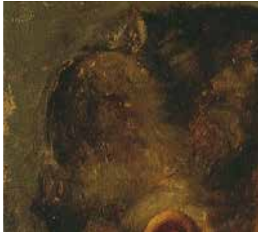
"La sala del hospital en la visita del médico en jefe" (1889), de Luis Jiménez Aranda.