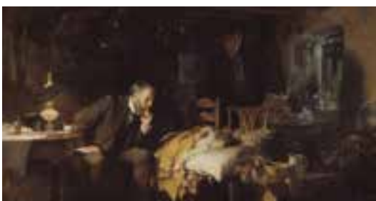
El cuadro "Ciencia y Caridad" en el Museo Picasso de Barcelona.