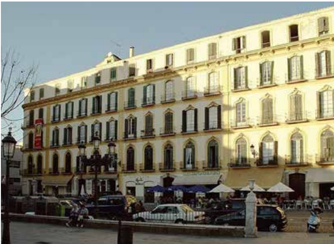
"Ciencia y Caridad" (1897), de Pablo Picasso.

Su padre, con el propósito de que Pablo participara en la Exposición Nacional de Bellas Artes, lo guió hacia un tema que unía la medicina moderna y el socorro asistencial. El realismo social era una corriente predominante en los estratos más conservadores de la segunda mitad